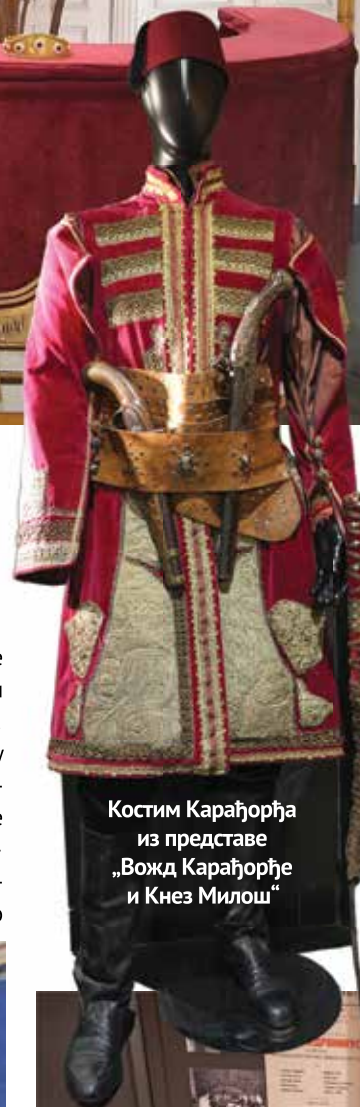
Костим Карађорђа из представе „Вожд Карађорђе и Кнез Милош“