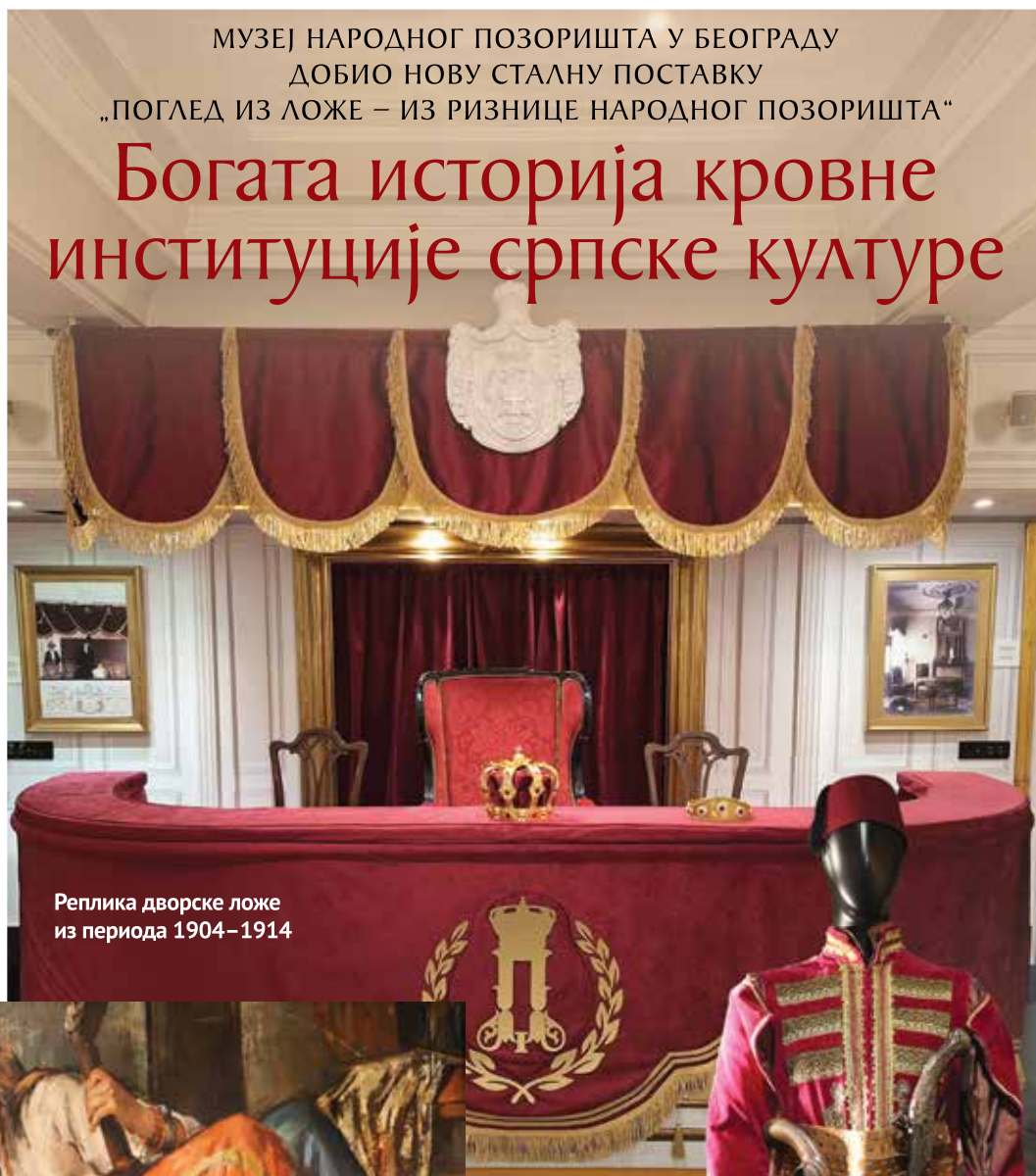
Реплика дворске ложе из периода 1904–1914

атмосферу нашег националног театра, од самих почетака па до модерног позоришног израза, и кроз поједине костиме,