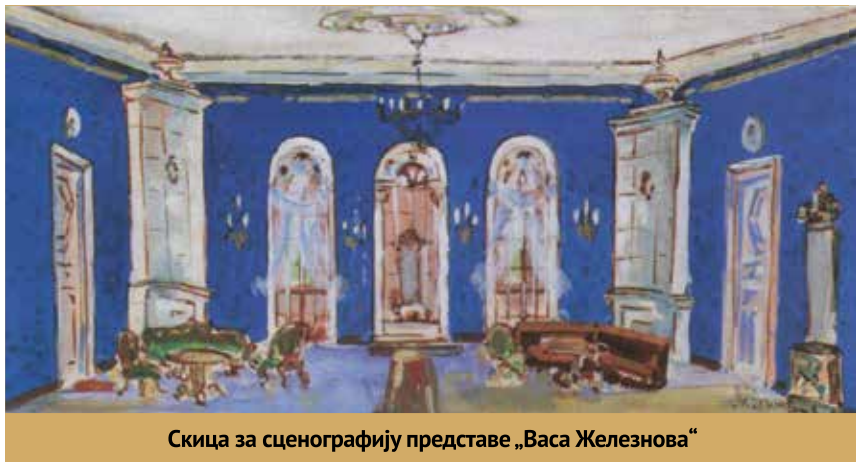
Скица за сценографију представе „Васа Железна“

позориште било огледало друштвених прилика и носи-лац националног идентитета.