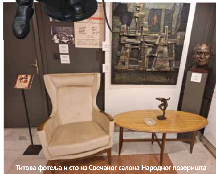
Титова фотеља и сто из Свечаног салона Народ-ног позоришта