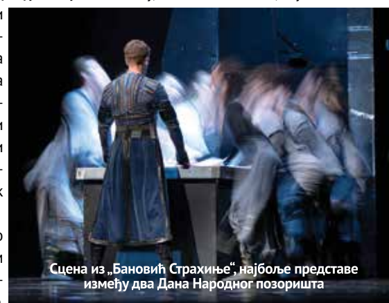
Сцена из „Бановић Страхиње“, најбоље представе између два Дана Народног позоришта