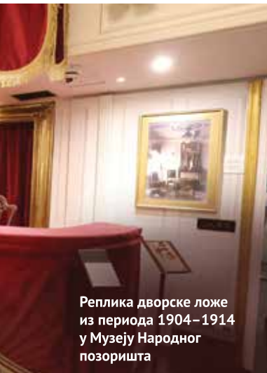
Реплика дворске ложе из периода 1904–1914 у Музеју Народног позоришта

Изложба представља и значајан тренутак у области историје уметности: аутори су приликом припреме поставке дошли