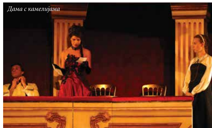
Дама с камелијама