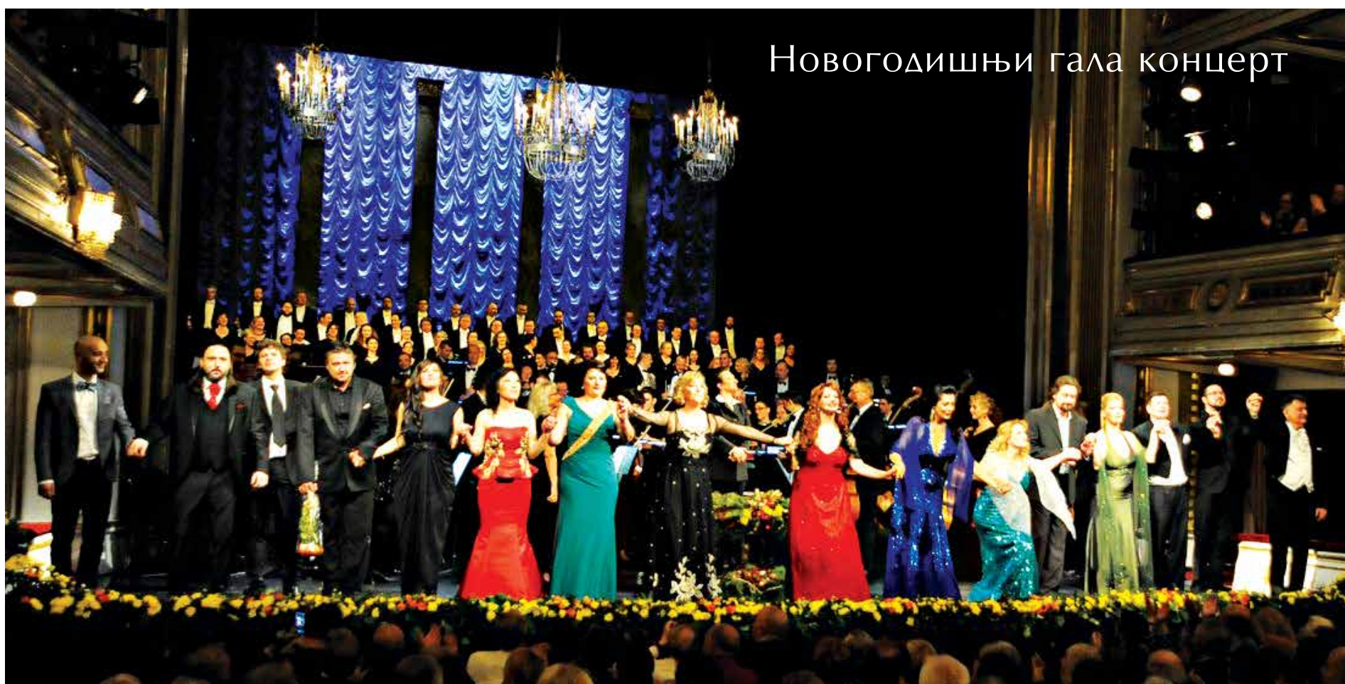
Новогодишњи гала концерт

НАРОДНО ПОЗОРИШТЕ У БЕОГРАДУ ПРОСЛАВИЛО КРСНУ СЛАВУ – СВЕТОГ ЈОВАНА КРСТИТЕЉА