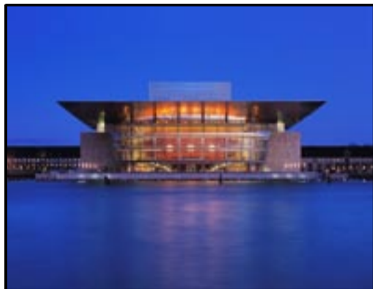
„Не само за уживање“ (запис на порталу, на улазу у позориште)

Д анско краљевско позориште је једно од најстаријих националних позоришта у Европи. Основано га је 1748. године краљ Федерик V, по узору на европска краљевска позоришта, са циљем да се у њему играју позоришни комади на данском језику. Карактеристично је да је у том периоду дворски језик био – француски, административни – немачки, док су се данским језиком служили нижи слојеви друштва.