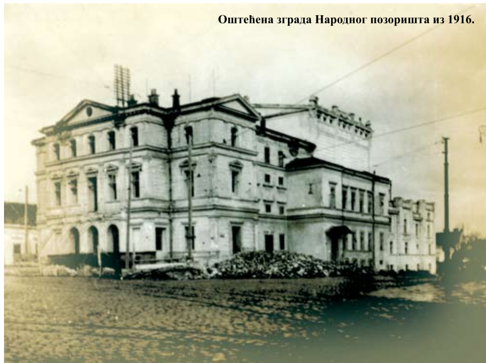
Оштећена зграда Народног позоришта из 1916.

ски. Почетком 20. века на сцени Народног позоришта су гостовале трупе европских позоришта, што је омогућавало да се публика упозна са новим уметничким токовима и глумачким изразима, као и да се успоставе нова критичка мерила у кругу стваралаца.