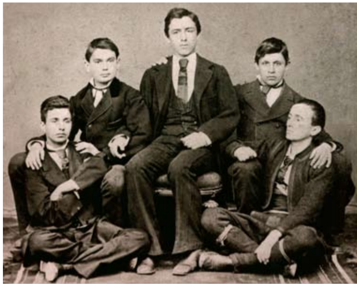
Нушић као гимназијалац са пријатељима