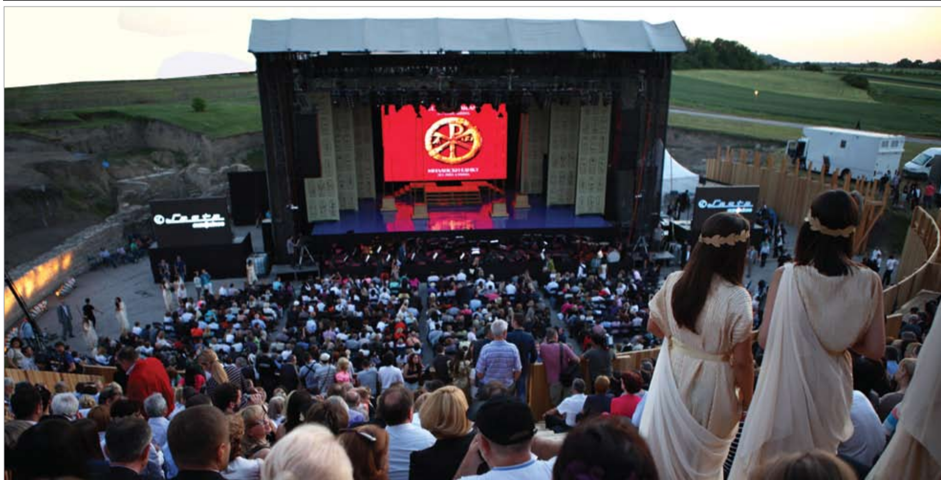
ВЕРДИЈЕВА „АИДА“ У РИМСКОМ АМФИТЕАТРУ АРХЕОЛОШКОГ ПАРКА ВИМИНАЦИЈУМ