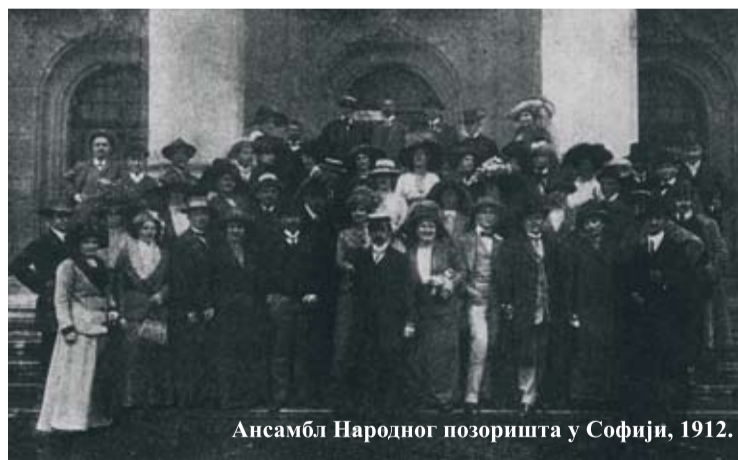
Ансамбл Народного позоришта у Софији, 1912.

Била је то лепо замишљена и корисна међусобна размена гостовања, али историјски догађаји