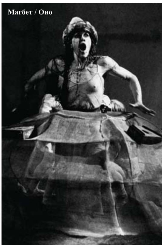
Магбет / Оно