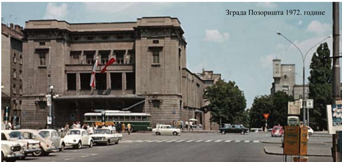
Зграда Позоришта 1972. године

Како би пребродило тадашњу кризу, материјалну али и ону коју зовемо „криза публике“, Народно позориште је поводом обележавања своје стогодишњице дошло на идеју да оснује јединствену организацију (свакако по узору на Théâtre national populaire и друга европска искуства произашла из климе и тенденција '68), Позоришну комуну. Циљ је био да се окупи што више добростојећих радних организација (подсетимо се мало и ондашње терминологије) које би са Позориштем засновале специфичну симбиозу, за добро свих. Привредне организације, банке, фабрике и друге РО помагале су театарске активности материјалним средствима, али су се (умерено) укључиле и у систем руковођења и организовања позоришта, а оно је, за узврат, приближило уметност радницима. И то не само кроз једноставан систем попушта на цене улазница и организоване посете представама, већ и кроз посебне „наручене“ програме који су се одвијали у згради Народног позоришта, Домовима културе, хотелским салама, просторијама у предузећима... Оснивали су се Клубови љубитеља позоришта у РО за чије „домаћине“ су бирани позоришни прваци, вођени су разговори