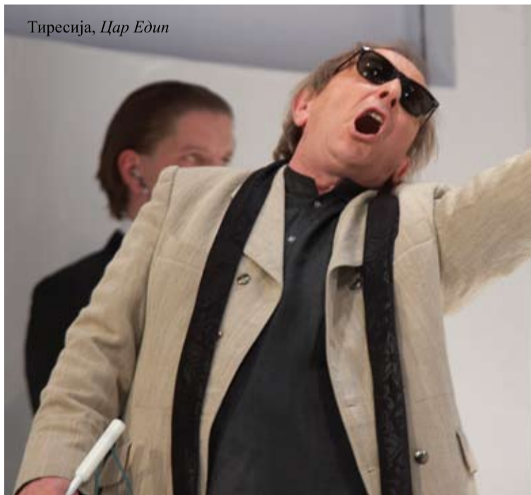
Тиресија, Цар Едип