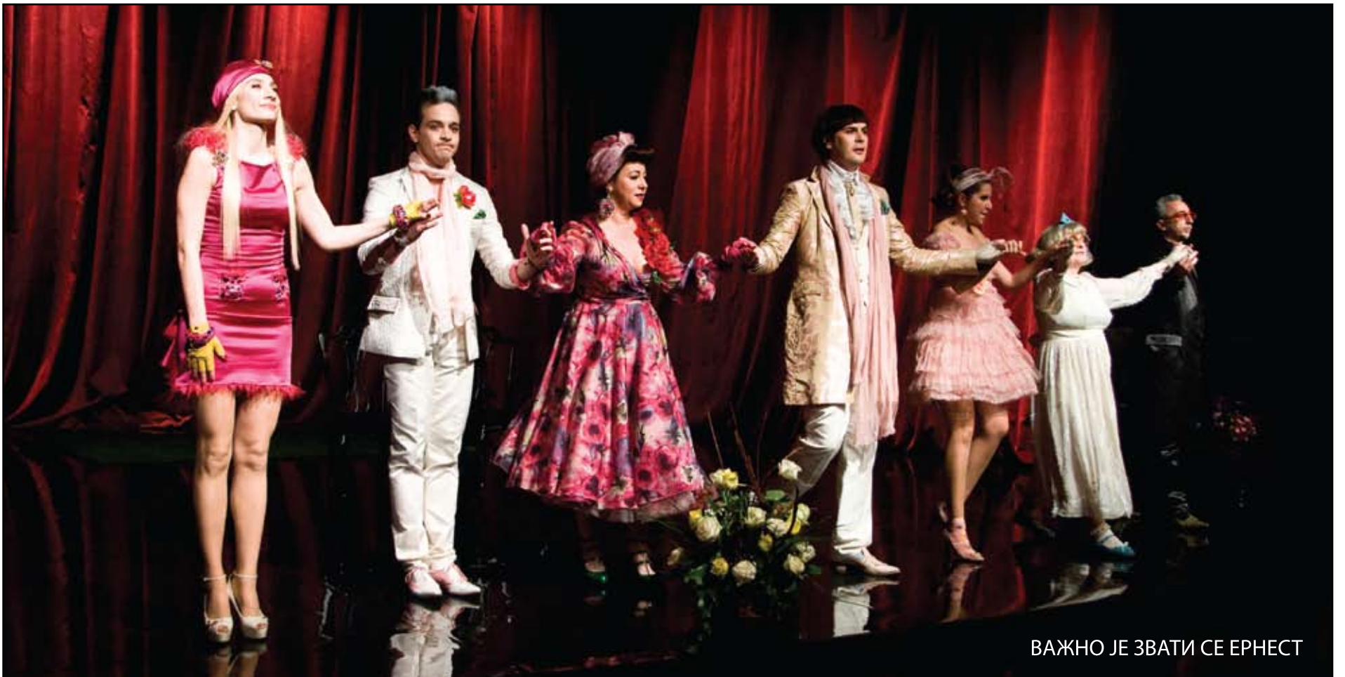
ВАЖНО ЈЕ ЗВАТИ СЕ ЕРНЕСТ

У МАРТУ ДВЕ ПРЕМИЈЕРЕ И ДОДЕЛА НАГРАДЕ „ЖАНКА СТОКИЋ“