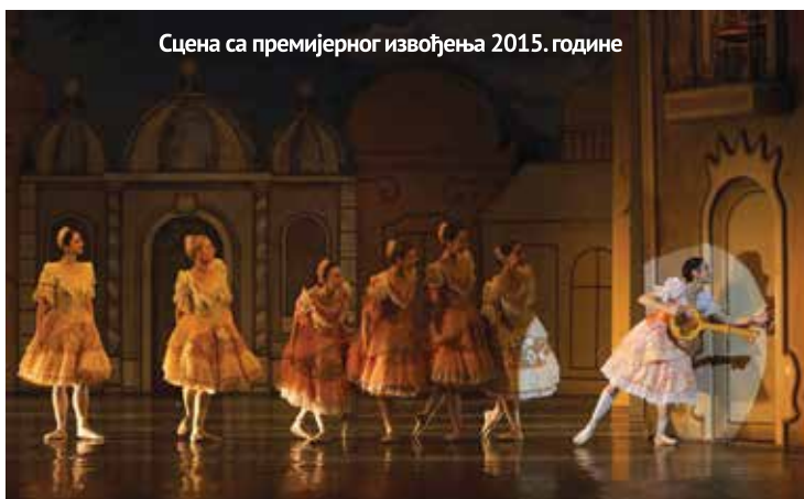
Сцена са премијерног извођења 2015. године