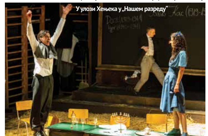
У улози Хењека у „Нашем разреду“

Ја верујем да су критичари истински оптимисти, пошто без људи који мисле да ствари могу и морају да буду боље, никада се ништа не би мењало. Мислим да је и Нушић пример једног таквог неуморног „оптимисте“. Кроз медиј позоришта и уопште уметности имао је моћно оружје којим је указивао на све оне „наопаке“ појаве које је бриљантно уочавао око себе. Његово огромно животно дело показује колико је био обузет таквим појавама и уопште разним друштвеним питањима, и мислим да се управо у томе нај-