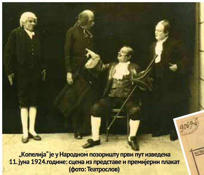
„Копелија“ је у Народном позоришту први пут изведена 11. јуна 1924. године: сцена из представе и премијерни плакат