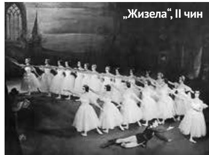
„Жизела“, II чин

валима у Визбадену и Лозани током 1958. године и то је била једна од најуспешнијих турнеја, а у балетској критици тог времена наилазимо на поређења наших уметника са вели-