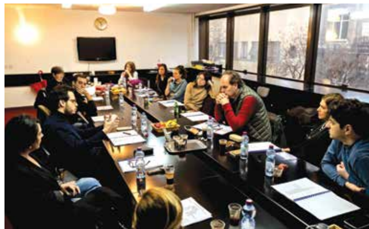
Детаљ са прве читаће пробе представе „Очеви и оци”