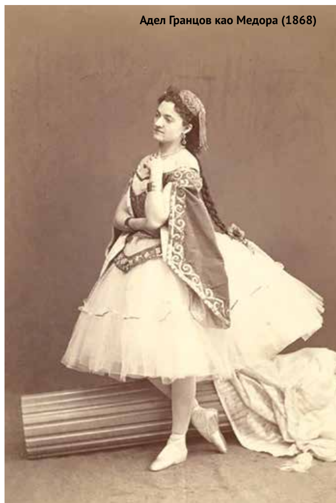
Адел Гранцов као Медора (1868)

графија додатно ће оплемењити ову бајковиту балетску причу. Посебан ексклузивитет представља чињеница да балет Гусар/Le Corsaire до сада није извођен на нашој сцени, изузев у сегментима. Од далеке 1923. године Балет Народного позоришта исписује странице балетске историје, а ускоро ће јој додати још једно значајно дело класичне балетске литературе.