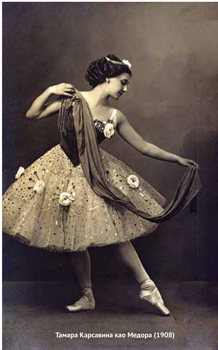
Тамара Карсавина као Медора (1908)

Као што смо већ најавили у претходном издању Позоришних новина , Балет Народного позоришта у Београду у овој години обележава значајан јубилеј – 100 година постојања. Јубиларни рођендан нашег Балета биће обележен низом манифестација, али централни догађај представља премијера балета Гусар/Le Corsaire која је предвиђена 19. марта 2023. године, када је, истог датума, али далеке 1923. године на сцени националног театра изведена прва целовечерња балетска представа.