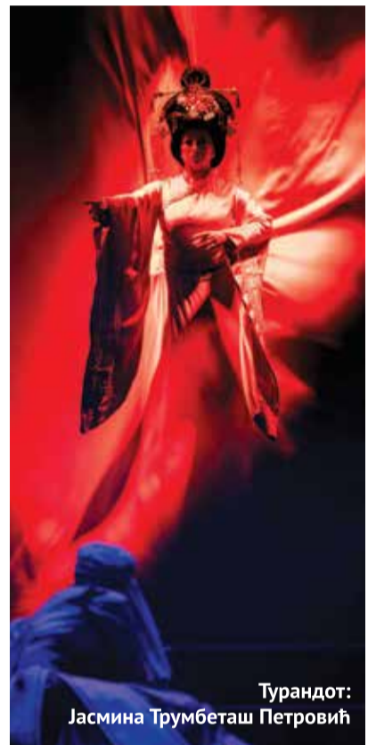
Турандот: Јасмина Трумбеташ Петровић

Вечерас ће, такође под његовом управом, на другој пре-