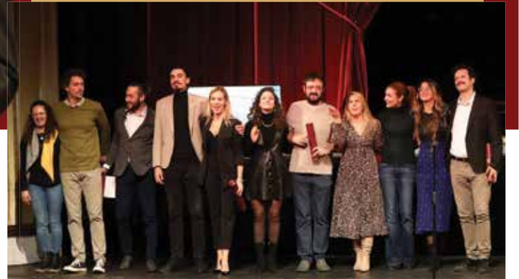
Награда позоришта за најбољу представу у протеклој сезони - „Рат и мир” (на слици: део екипе представе)

„Прошле године, у ово време, рекао сам да је Народно позориште старије од свих нас и да морамо да учинимо све што можемо да сачувамо достојанство и част ове куће, да ничији приватни интереси не могу бити значајнији од разлога постојања националног театра. Хвала вам што сте ме озбиљно схватили. То је велика мотивација. Настављамо даље. У том смислу ћу за крај поновити. Народно позориште је ваше позориште. Немојте га никоме дати. Чувајте га љубоморно да би будуће генерације биле поносне и почастоване што су ваши наследници. Честитам вам