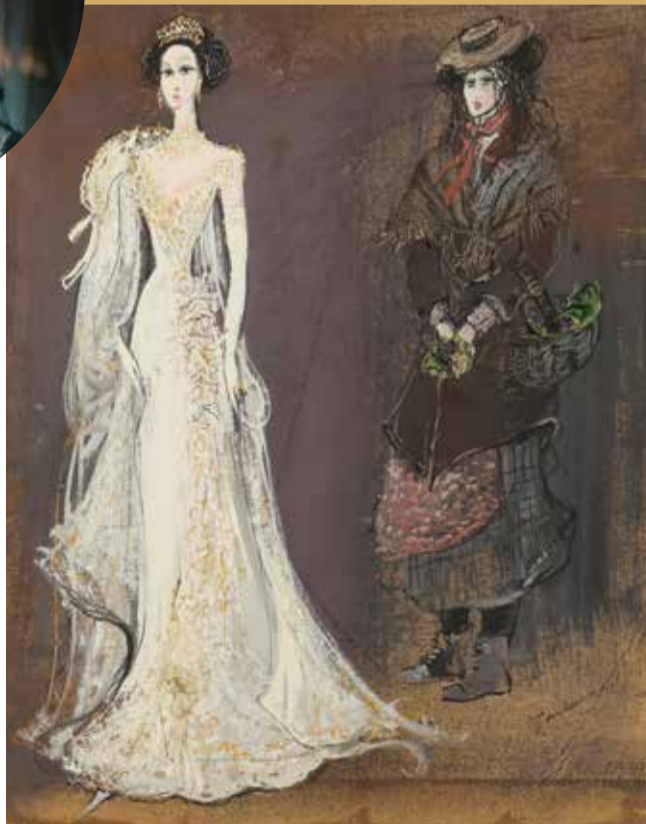
Скица костима Елизе Дулитл; „Пигмалион“, 1994. Народно позориште у Београду