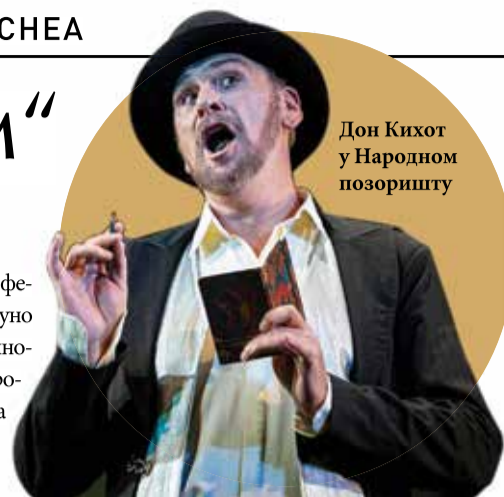
Дон Кихот у Народној позоришту

Већ 33 године сте у сталном ангажману у Опери Народног позо-