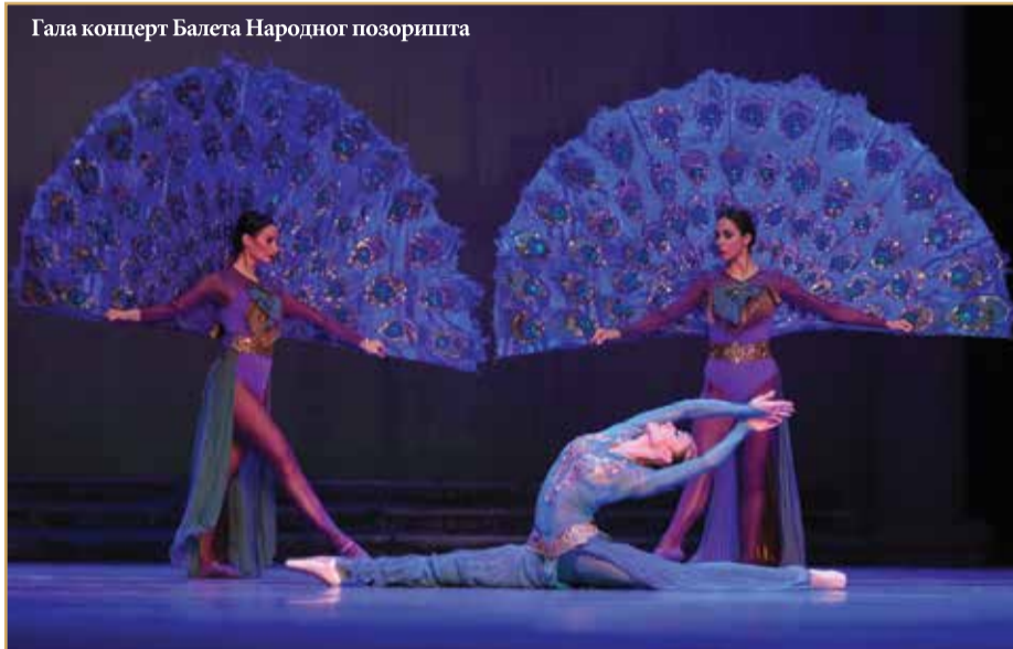
Гала концерт Балета Народног позоришта

П очетком месеца управа Народног позоришта послала је саопштење медијима у којем је истакнуто да ће национални театар у децембру радити у складу са најновијим мера-