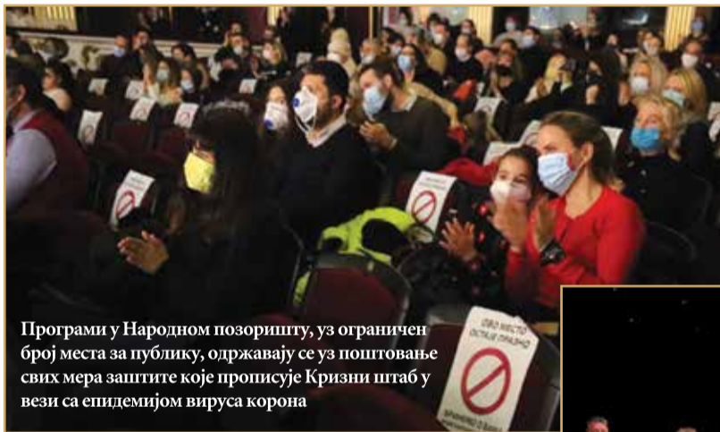
Програми у Народног позоришту, уз ограничен број места за публику, одржавају се уз поштовање свих мера заштите које прописује Кризни штаб у вези са епидемијом вируса корона

И балетски играчи, не само у децембру, већ и свих претходних месеци, од почетка пандемије, наилазили су на многе препреке и