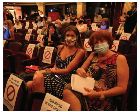
Физичка дистанца у гледалишту, у складу са свим епидемиолошким мерама

„Гвоздена жена ће се сломити, као трска, од сопствене амбиције.