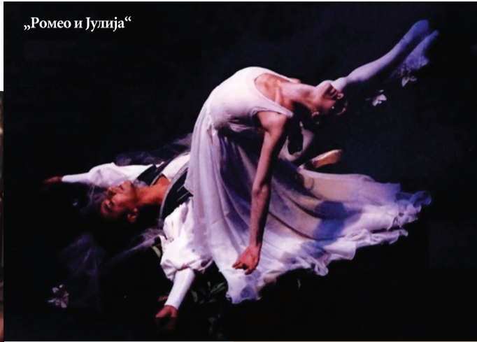
„Ромео и Јулија“