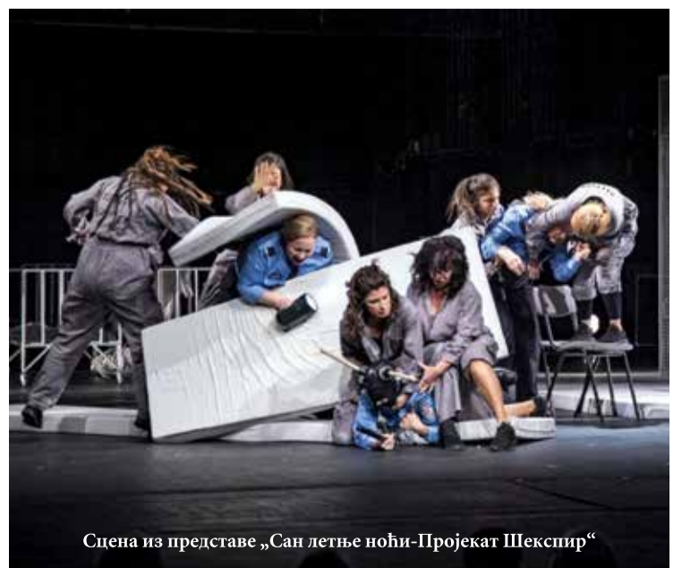
Сцена из представе „Сан летње ноћи-Пројекат Шекспир“