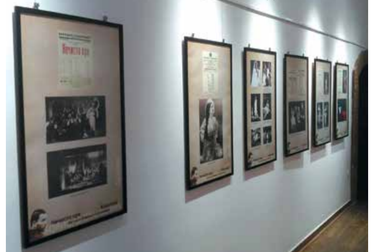
Детаљ са изложбе