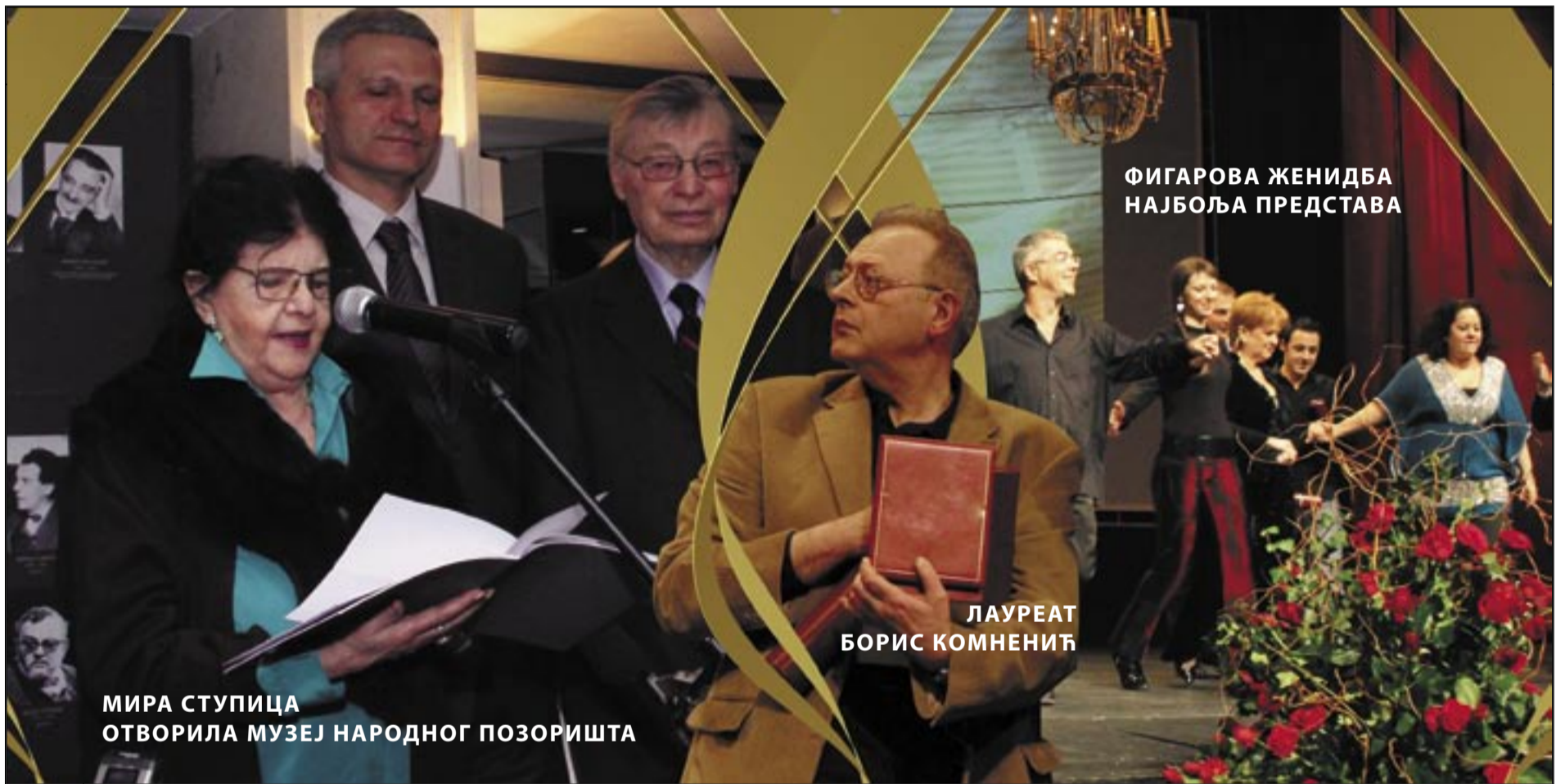
ФИГАРОВА ЖЕНИДБА НАЈБОЉА ПРЕДСТАВА