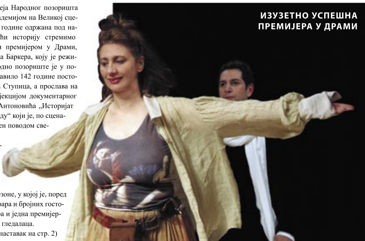
ИЗУЗЕТНО УСПЕШНА ПРЕМИЈЕРА У ДРАМИ