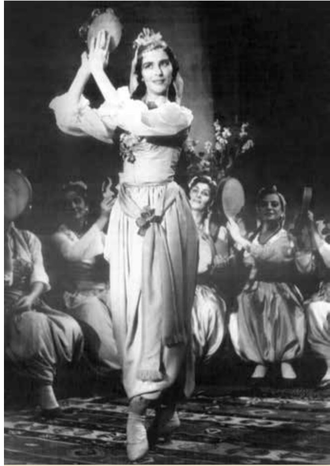
Радмила Бакочевић на свом дебију у улози Коштана, 19. 6. 1960.

вала се, као и увек, брзим сајореванјем . То значи да у току представе увек морам нешто да поједем. Чим уђем на сцену, мене води музика, тако да ја, тог неког дрхтања и страха, који веома негатив-