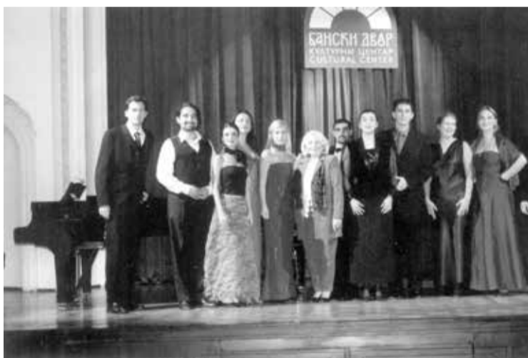
Оперски студио Народног позоришта у Београду на гостовању у Банском Двору, 2003.