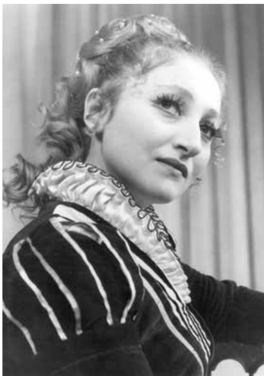
Као Ђилда у представи „Риголето“, 1974.