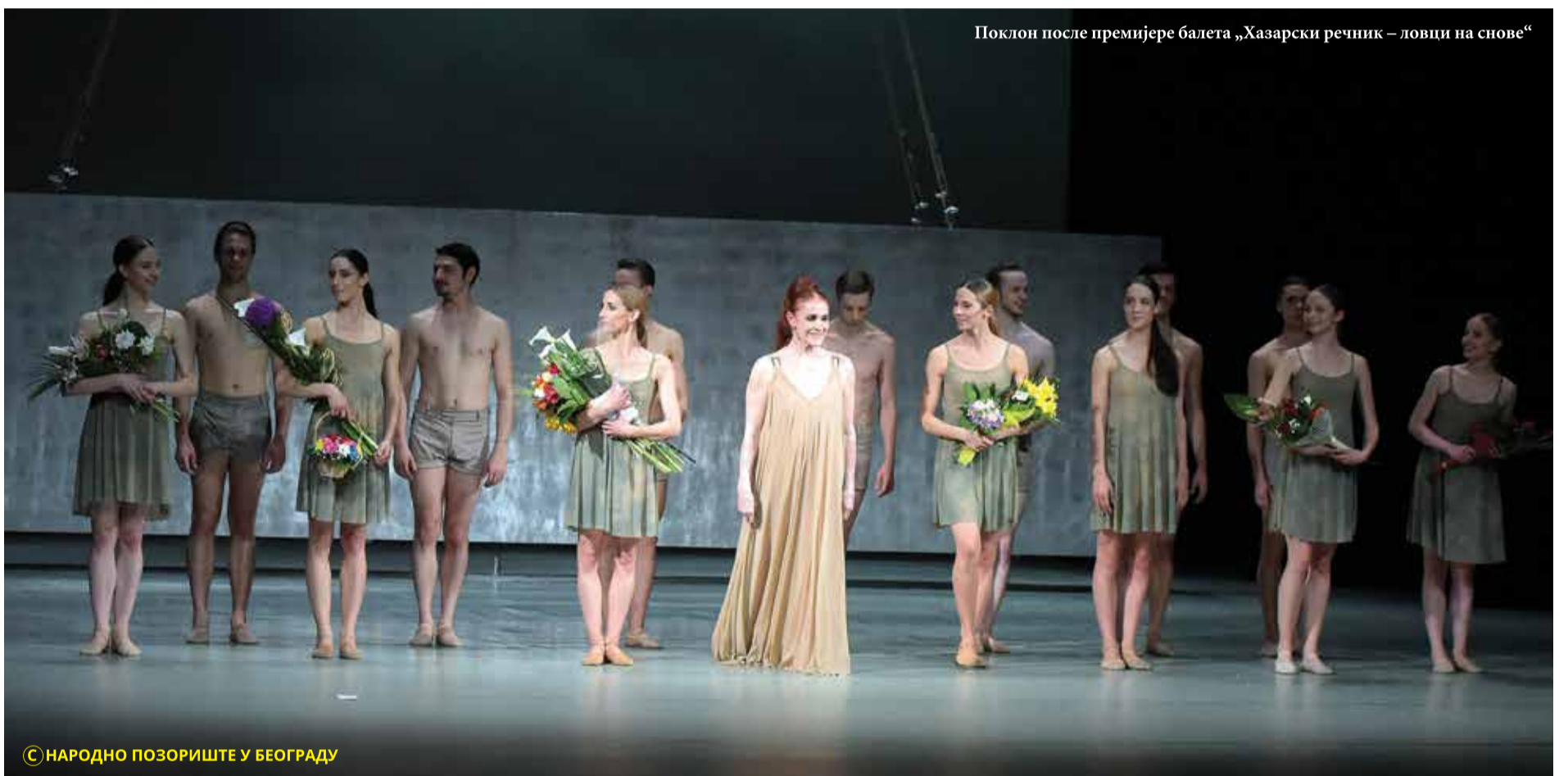
Поклон после премијере балета „Хазарски речник – ловци на снове“