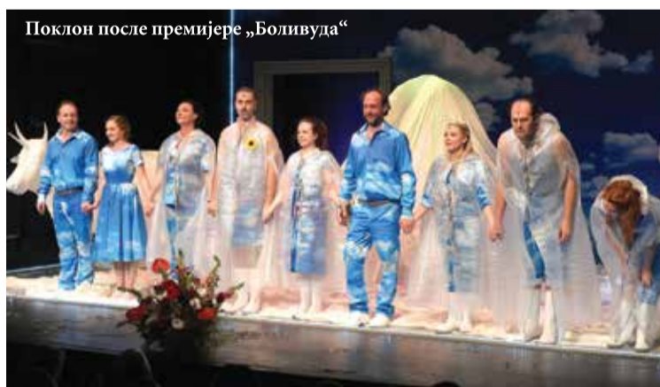
Поклон после премијере „Боливуда“