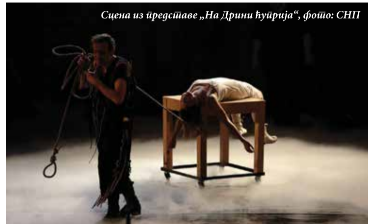
Сцена из представе „На Дрини ћуприја“

Шабачко позориште гостовало је 30. новембра на Сцени „Раша Плаовић“ са представом „Каинов ожиљак“, по роману Владимира