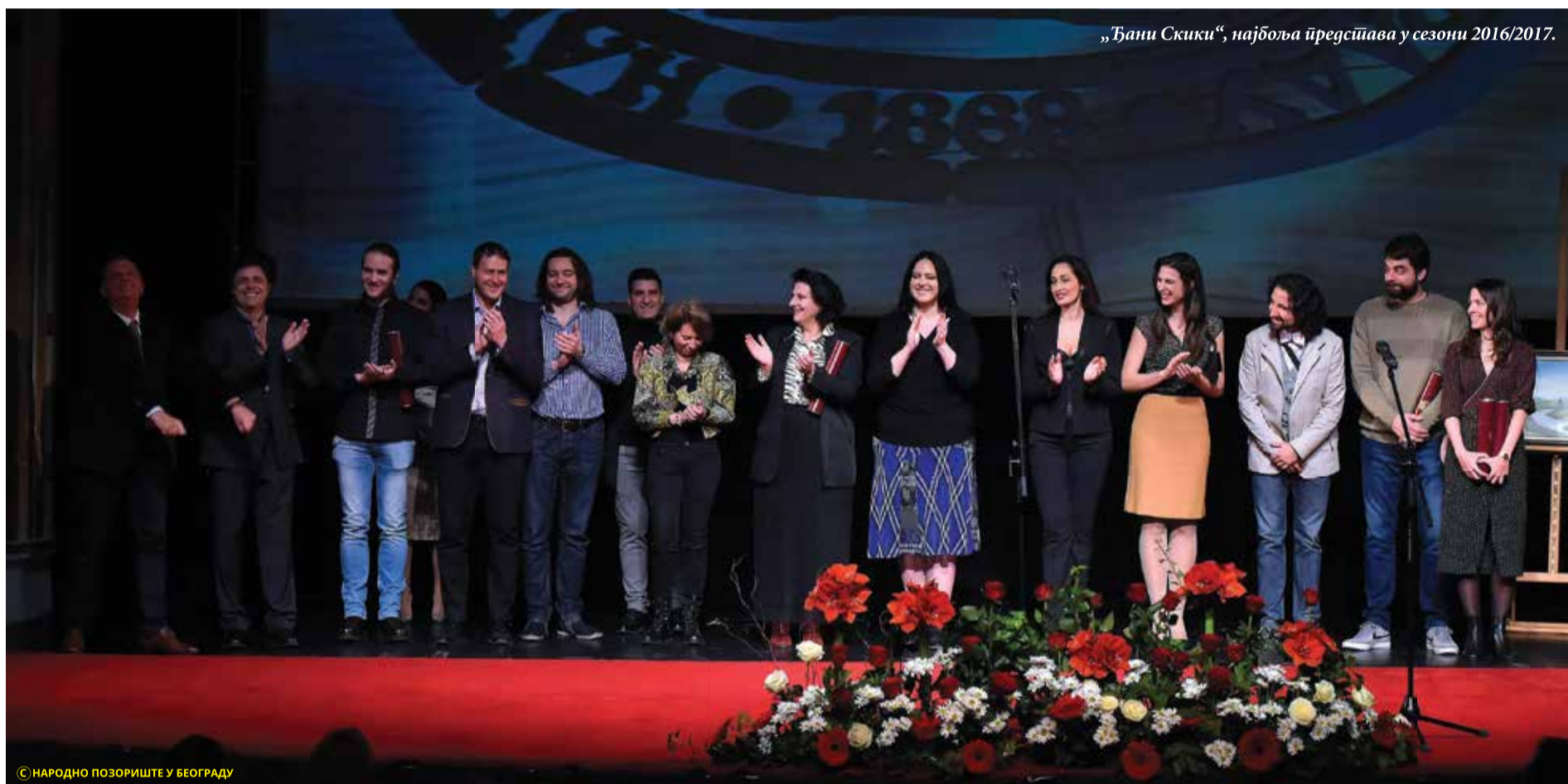
„Ђани Скики“, најбоља представа у сезони 2016/2017.